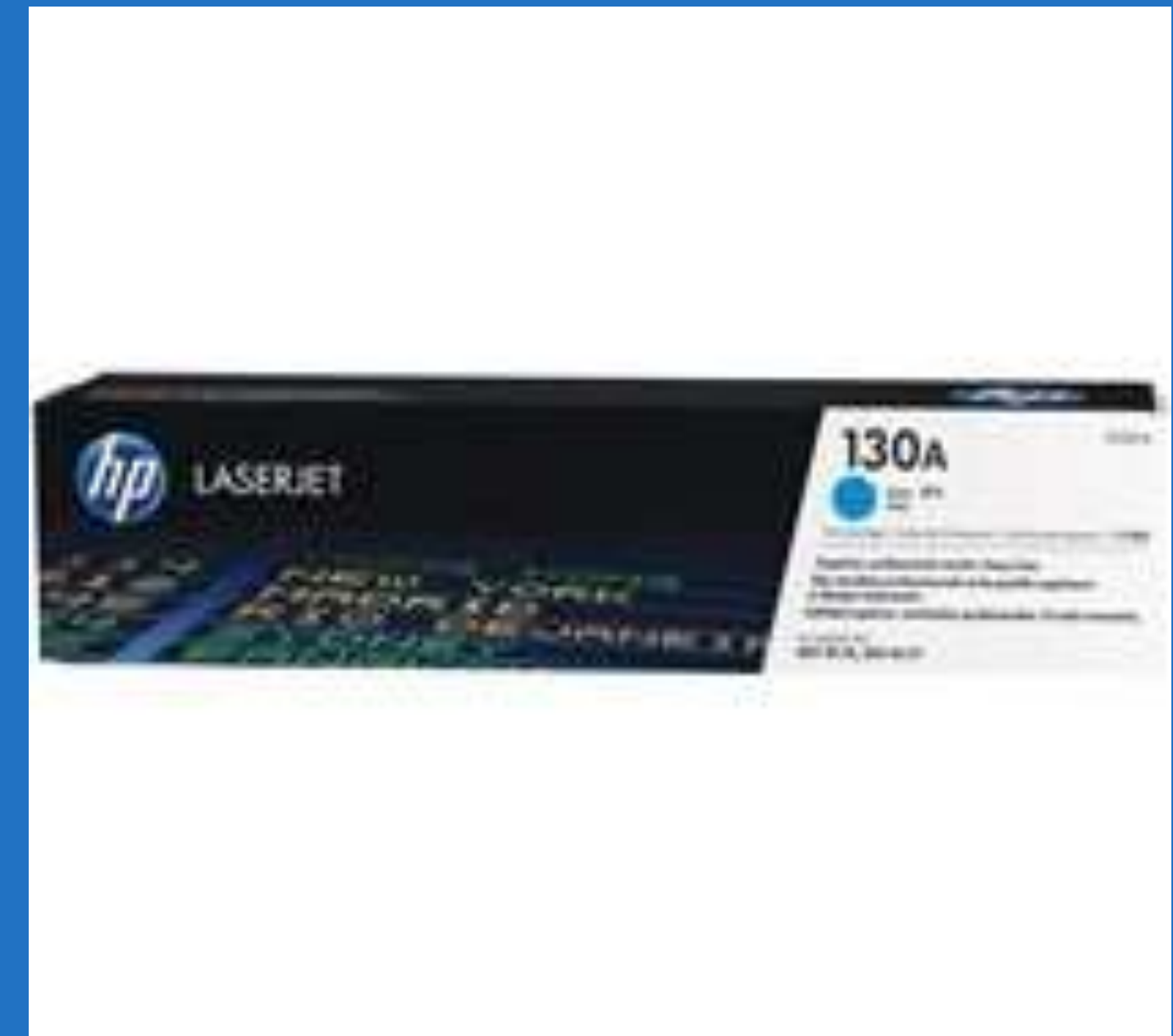
Toners marques Brother ou HP